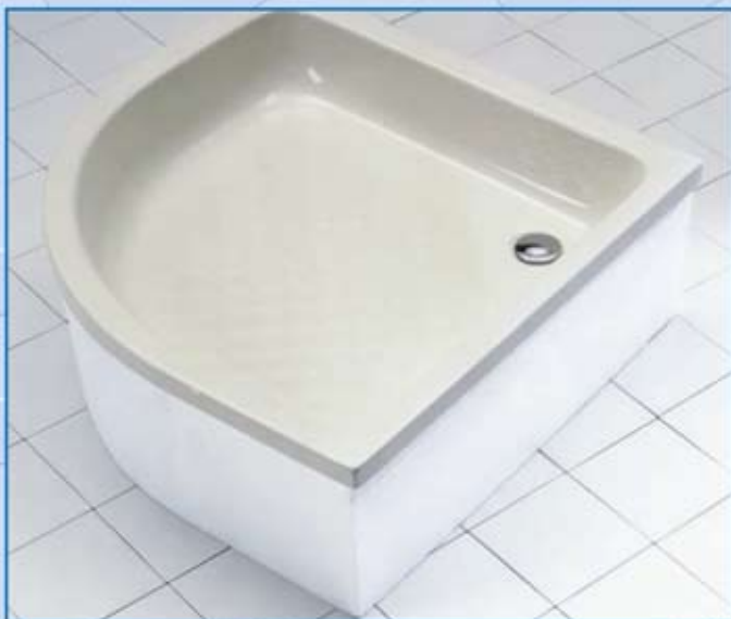
Duschwannenträger · Modell Java mit Träger

Für die Montage unserer Bade- und Duschwannen aus Acryl empfehlen wir die Ottofond-Wannenträger aus Hartschaum.