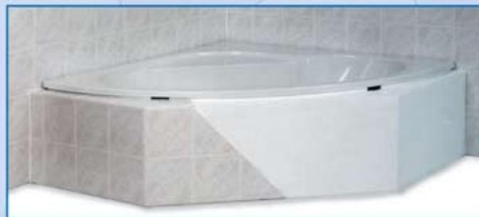
Eckwannenträger kurz vor Abschluß der Verfliesung

Die Außenmaße der Ottofond Wannenträger leiten sich vom Wannenmaß ab. Die Träger sind jeweils in Länge und Breite 30 mm kleiner als die betreffende Wanne (Beispiel: Badewanne 1800 x 800 mm = Träger 1770 x 770 mm; Duschwanne 900 x 900 mm = Träger 870 x 870 mm). Maßskizzen der Träger erhalten Sie über den Markt/Fachhandel oder im Internet unter www.ottofond.de .